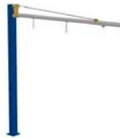
Aluminium zwenkcrana voor lage inbouwhoogte LR86 tot 40 kg

LRAVL kolomzwenkkranen met lage inbouwhoogte