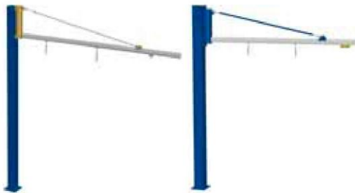
Aluminium zwenkcrana LR86 tot 80 kg